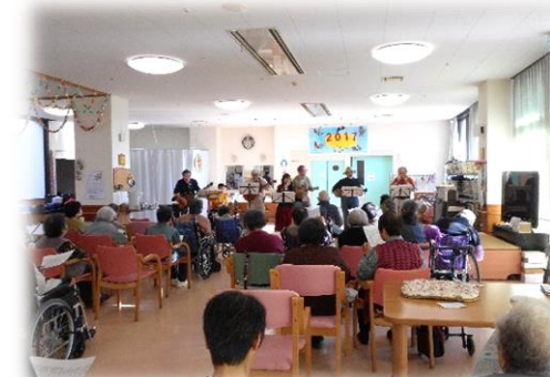
バンド演奏の慰問