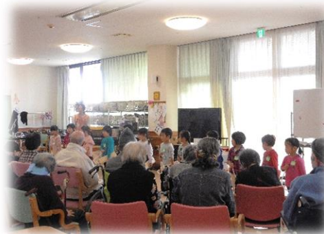
保育園園児との交流会