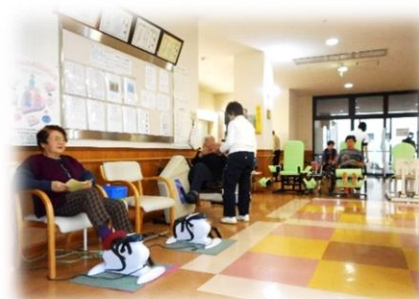
マシントレーニング