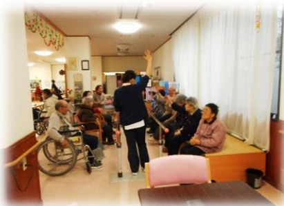
平行棒を使用したリハビリ